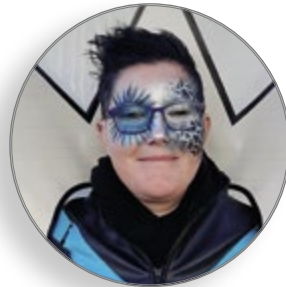
Magali Clerc Manifestations & Carnivals